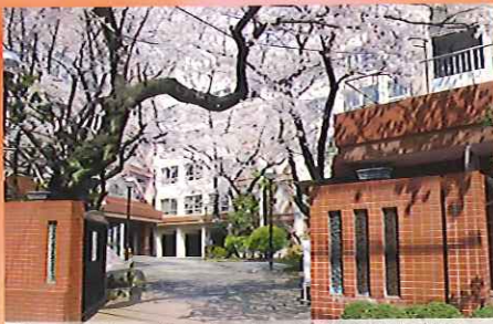
Komagome is famous for its cherry blossoms and you will be able to enjoy the cherry blossoms in full bloom in the end of March.